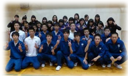
男子優勝チーム 2年2H 前期球技大会に引き続き2連覇達成です!