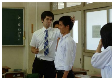
医療(リハビリ等) 分野