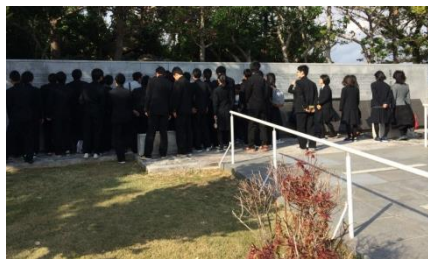
兵庫県慰霊塔(のじぎくの塔)にて