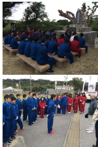
Gamma追体験前後の様子

Gamma追体験では、現地ガイドさんからGammaの紹介や戦争中のお話を聞きました。Gammaは、戦時中に住民の避難壕や日本軍の陣地壕、野戦病院壕として使われていたそうです。その後、実際にGammaの中に入り、懐中電灯の明かりも消して、当時の様子などのようなものであったか体験してみました。