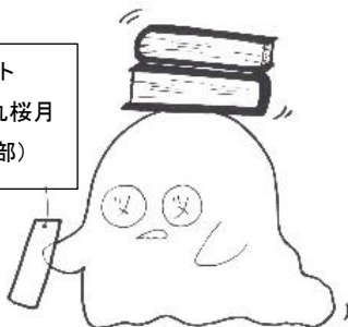
イラスト 3-1 田丸桜月 (美術部)