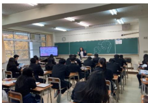
消費者教育出前講座 11月15日 3年生

本日20日、2学期の終業式を迎えます。長い学期でしたが、無事終業式を迎えられたことに感謝の思いです。2学期の始業式で、「長い学期だけに、自分の成長に差がつく時になる。しっかりと行事や学習、3年生は進路実現に取り組みよう」という話をしました。各行事では、自分の役割を果たせた生徒が多かったと感じています。また、学習については、他との比較でなく、1学期の自分の取組と比べてどうだったかが大事です。いろいろな面から2学期に自分自身の頑張ったことや成長した点を振り返り、3学期、学年のまとめにつないでもらいたいところです。日々の取組が自分の経験や財産となり進路やその先の社会につながっていきます。 今学期も保護者のみなさま、地域のみなさまに大変お世話になりました。厚くお礼申し上げますとともに、引き続きのご支援を賜りますようお願い申し上げます。