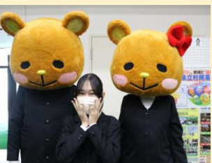
↑おーたんおーたん登場！