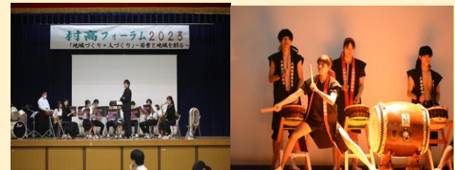
↑吹奏楽班演奏発表