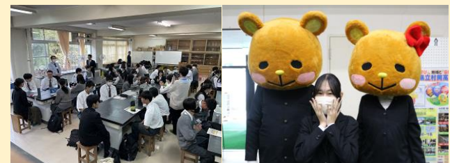
↑千種高校との交流