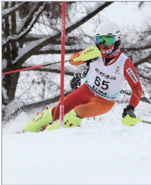
スキー部県総体 男子 33 連覇 (継続中) 女子 11 連覇