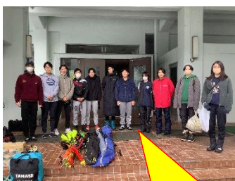
合宿に出発するスキー部(12月)