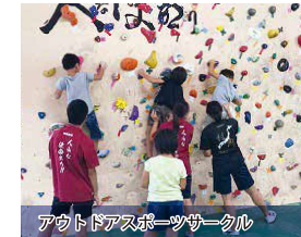
アウトドアスポーツサークル