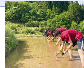
環境 A 班 (棚田保全)