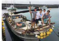
2年生修学旅行（沖縄）