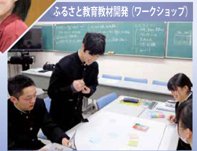
ふるさと教育教材開発 (ワークショップ)