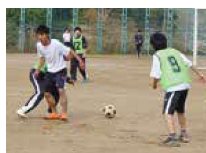
冬季球技大会（サッカー）