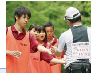
みかた残酷マラソン