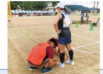
村岡ダブルフルウルトラランニング