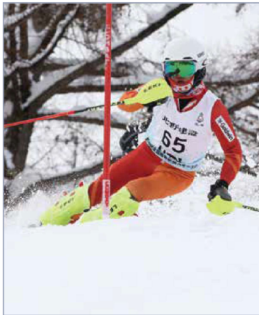
スキー部県総体 男子32連覇(継続中) 女子11連覇