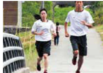
校内クロスカントリー