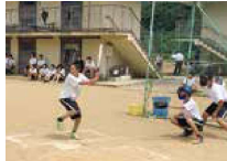
夏季球技大会（ソフトボール）