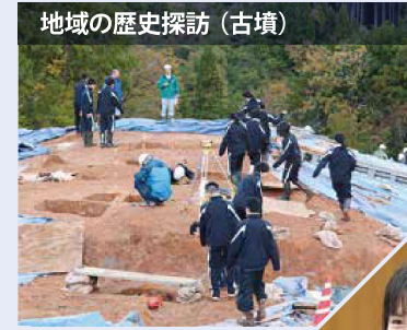
地域の歴史探訪 (古墳)

地域を教材として課題発見・比較検証・実践を基礎とした学習活動を行います。課題を見つけ、情報収集、情報発信をする力を身につけることが目標です。大学や社会で必要な問題解決能力、コミュニケーション能力、プレゼンテーション能力を育みます。