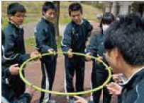
1年生野外活動訓練（仲間づくり）