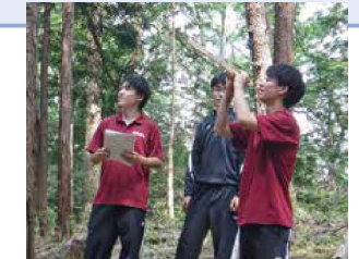
環境 B 班 (森の健康診断)