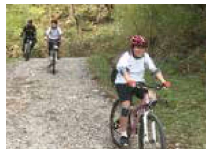
1年生アウトドアスポーツ系合宿研修