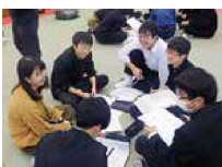
進路説明会（カタリバ）