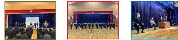
左から着任式、対面式、離任式