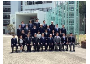
令和4年度の村岡高校スタッフです

春は出会いと別れの季節です。村岡高校でも多くの出会い、そして別れがありました。新しい先生との出会い、先輩や後輩との出会いなど、これらの出会いは、村高生にとって大きな財産になります。