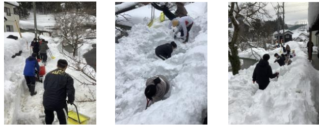
2/10(木) 村岡区板仕野 消火栓周辺、公民館への道