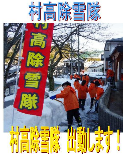
2/7(月) 本校と村岡小学校の間の歩行者用小径

村高除雪隊は、「村高発☆地域元気化プロジェクト」の地域福祉班を中心とした冬季限定の活動です。今シーズンは、12月から幾度となく大雪に見舞われ、雪かきが追いつかない状況です。除雪は、大きな幹線道路のような公助の範囲から、玄関前や屋根の上といった自助の範囲までさまざまです。少子高齢化、過疎化が進む自分たちの地域で、村高生がそのような生活のすき間を埋めることができればと考えています。授業や部活動等もあり、満足な活動はできませんが、2月第2週に2度出動しました。