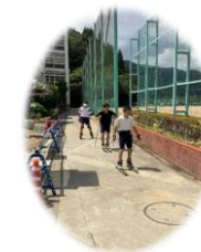
←アウトドア スポーツ