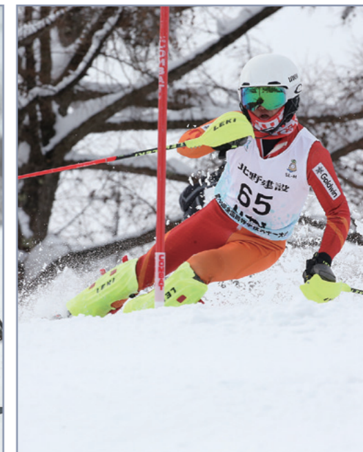
スキー部県総体 男子31連覇(継続中) 女子11連覇