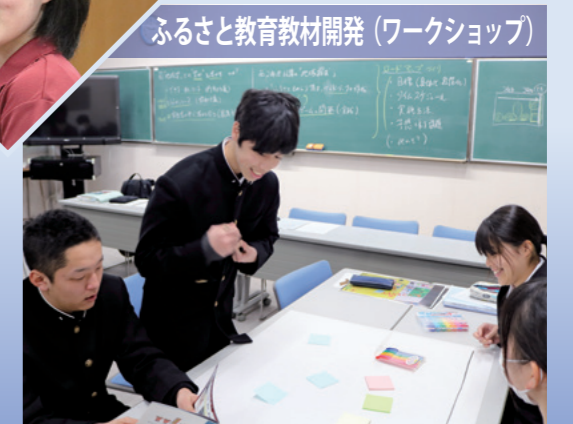
ふるさと教育教材開発(ワークショップ)