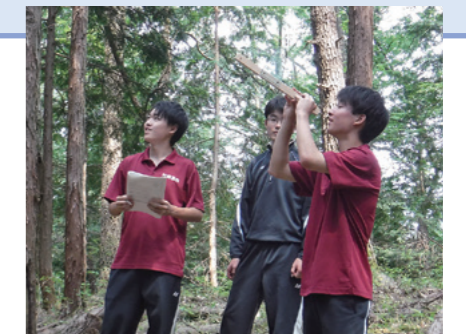
環境B班(森の健康診断)