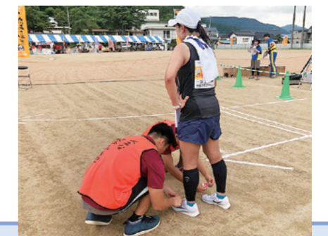
村岡ダブルフルウルトラランニング