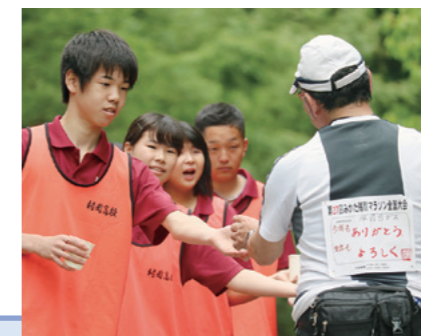
みかた残酷マラソン