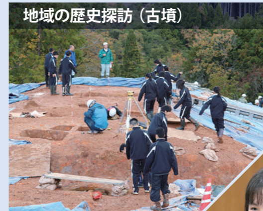
地域の歴史探訪(古墳)

地域を教材として課題発見・比較検証・実践を基礎とした学習活動を行います。課題を見つけ、情報収集、情報発信をする力を身につけることが目標です。大学や社会で必要な問題解決能力、コミュニケーション能力、プレゼンテーション能力を育みます。