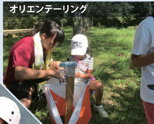
オリエンテーリング