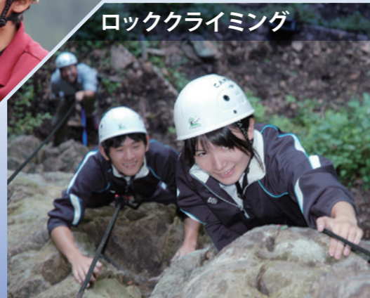
ロッククライミング