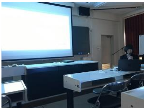
～英語表現Ⅰ授業より～