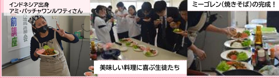
美味しい料理に喜ぶ生徒たち

2日の午後には、三木市国際交流協会の方々のご協力の下、今年度第3回目となる出前講 座を開催しました。いつもは、「見て・聞いて・話して」世界のことを知る出前講座ですが、今回 は「食べる」も追加し、さらにその国についての興味を引き出すプログラムとなっており、生 徒達は大喜びで楽しみながら異文化体験を行いました！ インドネシア料理「ミーゴレン」とタイ料理「カウキャオ」と「ラブガイ」を目の前で調理し、 ふるまっていたいただきました！！