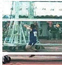
西島さん 投てきの様子

来年もう一度近畿ユースに出場できるように、残りのシーズンと来シーズンも有意義な練習にしていきたいです。