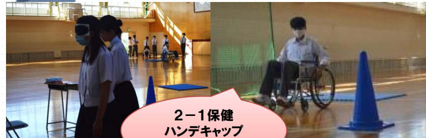
2-1保健 ハンデキャップ 体験実習の様子