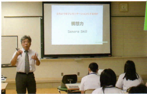
大学の先生による授業

スピーチ、ディスカッション、ディベート、プレゼンテーション等を取り入れた授業展開を実施します。「中国語」「フランス語」等の英語以外の外国語を学ぶ機会も設けています。また、英語の専門性を高めるために、年に数回大学の先生を招いて特別講義も実施します。