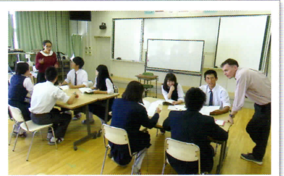
ALTによる少人数制授業

発表する機会や、個別に指導する機会を増やすため、コミュニケーションに関する授業や選択科目などを少人数展開で実施します。生徒一人ひとりに対し、きめ細やかな指導ができると同時に、生徒が主体的に学ぶことができる体制を整え、全教科の学力向上を図ります。