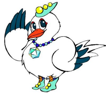
大会マスコット 『こうたん』