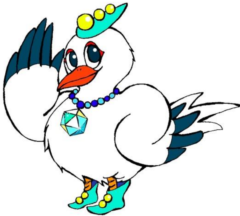
マスコットキャラクター「こうたん」