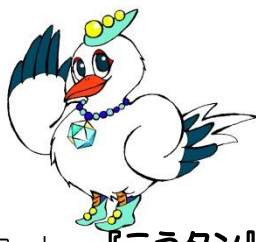
大会マスコット 『こうたん』