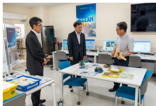
STEAM Lab で説明を受ける様子