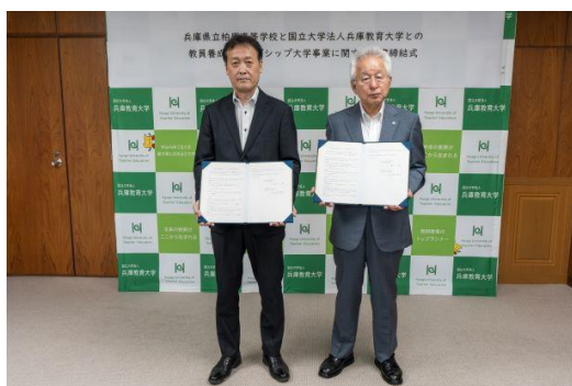
覚書締結式での写真撮影

これにより、兵庫教育大学が研究する最先端の教育資源を活用することで、本校の教育活動がますます充実することが期待されます。