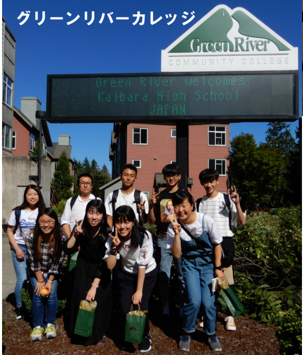
グリーンリバーカレッジ