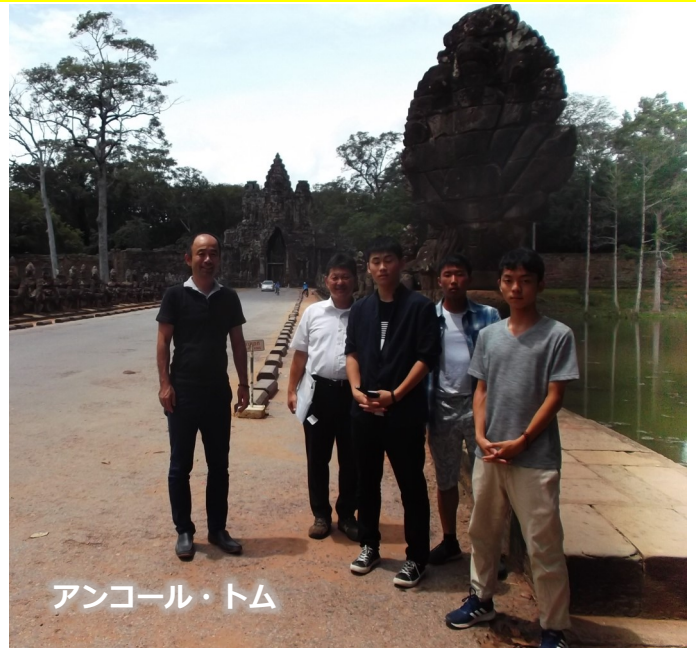
アンコール・トム