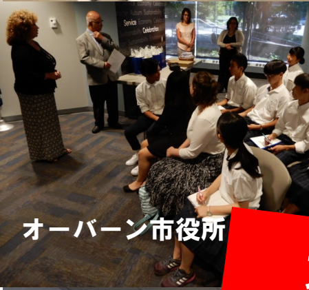
オーバーン市役所