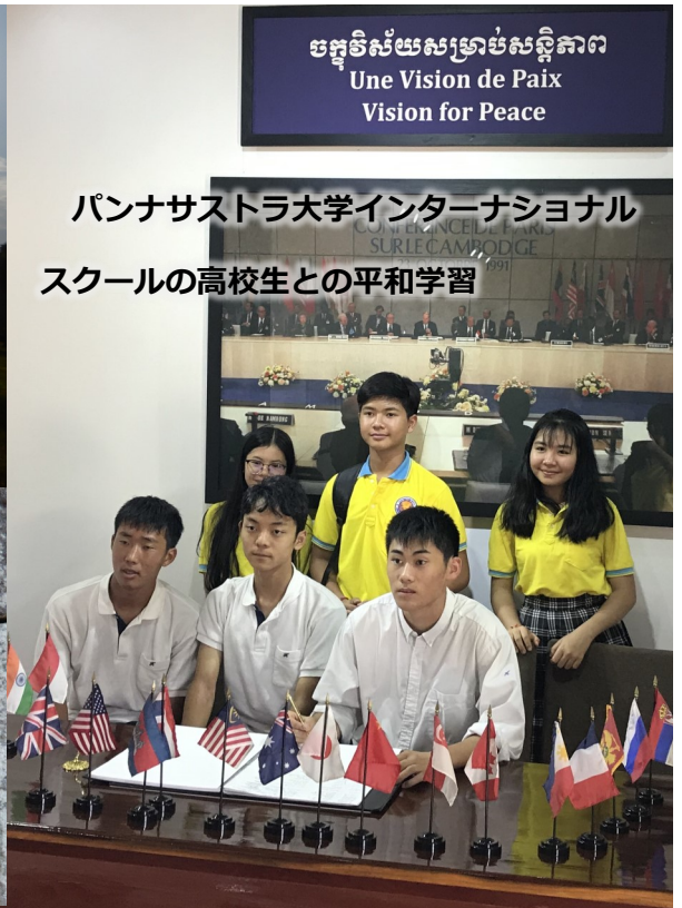
パンナサストラ大学インターナショナル スクールの高校生との平和学習