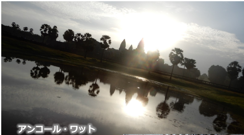
アンコール・ワット