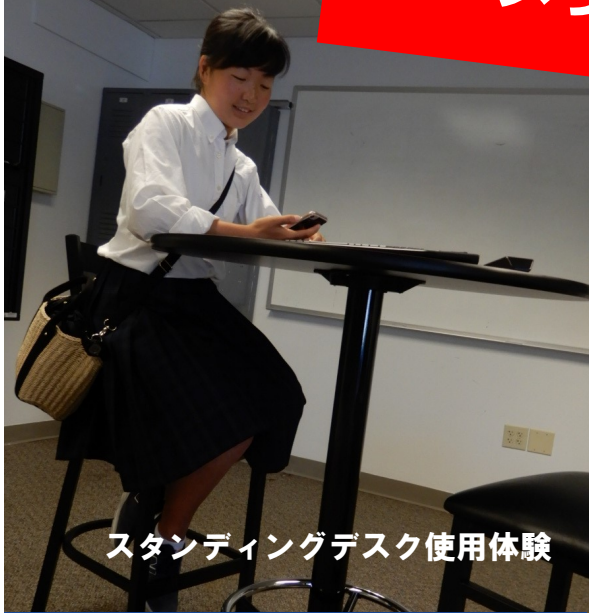
スタンディングデスク使用体験

この研修では、探究Ⅱに取り組んでいる、「多文化共生」「スタンディングデスク」「柏原高校をよくする方法」についての理解を深めることを目的とし、様々なことを学びました。その中でも多文化共生の課題については、実際に現地の学生と交流し、視点を変えて相手の気持ちを考え、どのような考えにも理解や思いやりをもつことが大切だということを知ることができました。その結果、アメリカが多文化共生できている理由は、肌の色などの違いをその人の個性として、みんなが受け入れているからだということを知りました。今まで、自分が踏み入れなかった分野や考えなどを調べて少しでも視野を広げようと思いました。