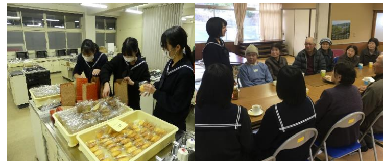
前日袋詰め作業(324人分)