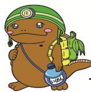
生野高校マスコット 「いくのん」