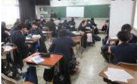
ホントに『最後の授業』の様子です

朝、本誌編集長が出るとA棟の外(男子トイレ下)で放り投げられ散らしているトレットペーパーを回収してくれている事務長さんを見、 「すみません」 と謝りました。前日より2年生は修学旅行で不在です。確実に3年生の授業です。A棟2階でも散乱するト