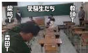
事前指導の様子です