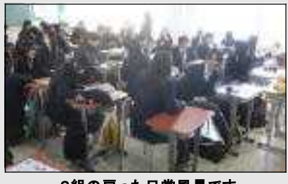
2組の戻った日常風景です

新学期が始まり、どのクラスにも『日常』が戻ってきました。しかし、授業は何と1月9日～1月20日の7日間だけです。ホントにあつちという間の『日常』をしっかりと噛みしめて下さい。