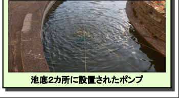
池底2カ所に設置されたポンプ

ぶくぶくぶく、イカ高池(昇降口前)に吹き出る謎の空気泡。何だ、これは? 池の金魚の待遇改善のため、酸素ポンプが設置されました。喜び金魚たち。これで野鳥に捕食される心配も減ります。また、この池に水が張ったとき、「中の金魚、窒息しないん?」と心配をするイカ高生(実話)も減るでしょう。