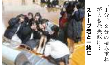
ストープ君と一緒に