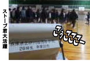
ストープ君大活躍

エライ事です。でもご安心を。北海道の空気は結構乾燥しているのが、実際の気温より寒さを感じさせて、ここから怒涛の指示が続きます。「ネックウオーマー、必ず用意して下さい。安いところなら400円位、ソックスがスリッパを。」