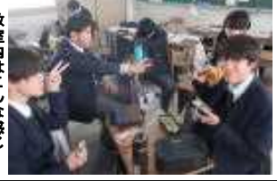
教室内はこんな感じ

12月3日(火)は期末試験前日であると共に、令和6年最後の『皆で一緒にとる昼食』でした。しかし、ほとんどの者がそのことに気付いていません。「今日が今年最後の昼メシや」「えっ、マジで?」「(じゃ、記念に1枚!」言われて初めて気付きます。「じゃ、記念に1枚!」お昼が「オリゴ糖とフルグラのみ」という人もいれば「四角いサイコロ卵焼き」の人もいます。お昼のメニューも十人十色です。この時期の食堂はちよつ