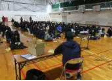
しおりの読み合わせ中です

皆キチンと反応してくれました(笑)。この日は寒かったのですが、当初の予定になかった『大型スト