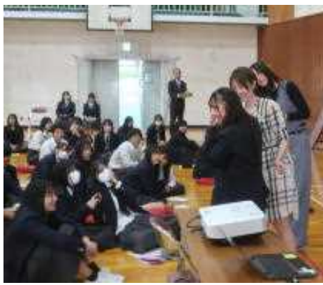
ステキな大先輩を前にタジタジのさん

私たち学年団が皆と関わる事ができるのもあと1年あります。皆が卒業してから、『周りの人たちに大事にされて過ごせるようになって欲しい』そう願っています。それにはまず、皆が『周りの人たちを大切にすること』から始めて下さい。