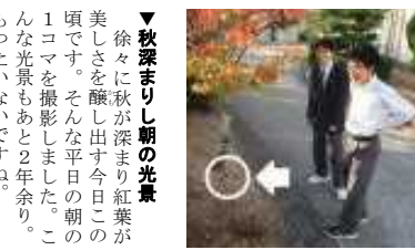
河合先生の領域ですな

▼秋深まりし朝の光景 徐々に秋が深まり紅葉が美しさを醸し出す今日この頃です。そんな平日の朝の1コマを撮影しました。こんな光景もあと2年余り、もったいないですね。