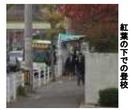
紅葉の下での登校