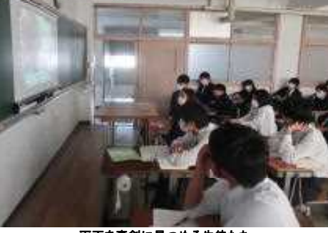
画面を真剣に見つめる生徒たち

11月5日(火)の2限目はシェイクアウト訓練でした。この時だけは、スマホの電源ONが可能です。久々のオンライン実施かつ新タブレットでの接続で、全教室が繋がった。時間がかりました。地震の放送が流れた後、ボロロリン、ボロロリン、という聞き覚えのある緊急地震速報がスマホに入り、訓練の開始です。そこから防災「身体が入らなくても頭を最優先で隠せ！」の言葉に皆、机の下に隠れます。身体をコンパクトにまとめています。