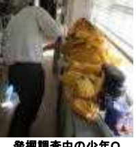
発掘調査中の少年O