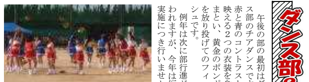
ダンス部フィニッシュ