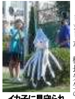
イカ子に見守られ