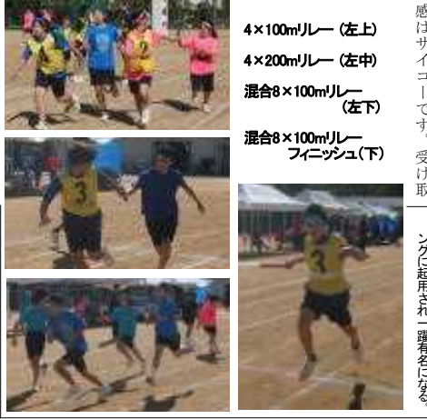
生徒会種目、一気に見てみましょう

がんばる部員達です 体育大会実施には、部活の部員が総動員され、招集・誘導・審判・記録・放送・用具・設備撤収他たくさん役割を果たしました。笑顔で役割を果たすその姿はグレートですね!