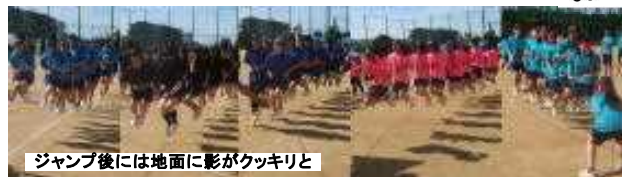
ジャンプ後には地面に影がクッキリと

大縄跳び：それは18人の友を間に挟み、両側の2人が延々縄を回し続ける過酷な競技である。各クラスに与えられる時間はウルトラマンと同じ3分間。この間に何回跳べたか、その回数を競うのである。 「それ、イチツ、ニ：あれ？？」 息を合わすのが大変です。気を取り直し、「まだイクルーっ」 疲れたら少し休みも入れながら、3分という時間を有効に使います。縄の横では跳んでいない級友が応援しています。 18名がウサギと全校通して最高は5組の40回でした。やはり数学的知識をフル活用か？