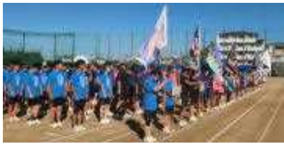
クラス旗を掲げて整列する生徒たち

予行に本番 予備日の予行も流れた『第49回体育大会』ですが、3学年揃って実施できるのは今年度が最後だったので、当初予定になかった10月25日(金)に代替実施しました。予行もなかったため、簡略バージョンでの実施です。なので行進もなし。すなわちクラス旗を上下逆向きに作った2組&3組はセーフでした(これを不幸中の幸いと言います笑) 体育大会になると現れる、イカ高名物『イカ子』も校旗の下で皆を見守っています。 実施責任者柴崎先生の「しっかりと楽しんで、メリハリつけて」の言葉の後、生徒会長の開会宣言で体育大会がスタートしました。校長先生の、