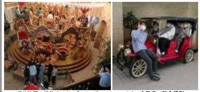
乗り放題の建物内メリーゴーランド レトロ自動車で記念撮影

こにはデカイバッテリーが。どうやら雨で自転車置いて帰るとき、(盗難防止で)バッテリーを持って帰ったとの事。 カバンの中のパネーリ ▼8時29分55秒 きわどい時間に図書室前を走らないで良いように余裕を持ちましょう(汗っ)