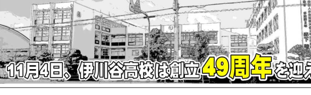
11月4日、伊川谷高校は創立49周年を迎えます