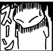
人付き合いが苦手だよ~

同性でも異性でも、『この人と居ると何か気が楽だなあ』って人、居ますよね。そういう人って『自分と波長が合う人』なんです。そういう人とはよく話していても疲れないし、逆に会話をすることがストレス解消にもなります。 それに引き替え、一緒に居ると疲れる人も居ますよね。イライラしたり、何かにつけて突っかかって来られたり。こういう場合、『相手を変える』はまずできないので、『自分が変わる』が必要以上に聞かない。それに限ります。そうしないと自分が疲れるだけです。腹が立つから『何とかしてやろう』と周りを巻き込むと、必ずそこに『いじめ』や『嫌がらせ』が発生しますから。 世の中、本当にたくさんの方が居ます。そして、その人と同じ数だけの『正義』が存在します。なので、自分の中の『正義』が他人にない場合もあるのです。