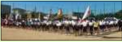
昨年度の体育大会集合の様子です

結構な雨のために、予定だけでなく予備日まで流れてしまった体育大会。今回は3学年揃う最後の大会であったため、その中止を悔やまれる声も聞こえてきます。今後、式典や講演会を除き、3学年が揃う行事もないため、ラストワンチャンス、10月25日(金)が体育大会予備予備日に設定されました。この日、晴れるか?