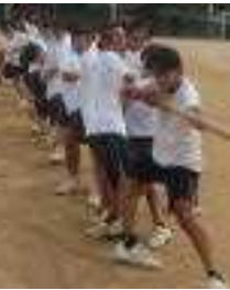
笑顔で楽しみます