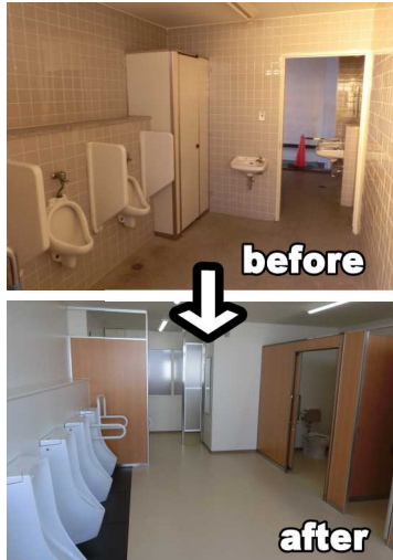
イカ高トイレの変貌