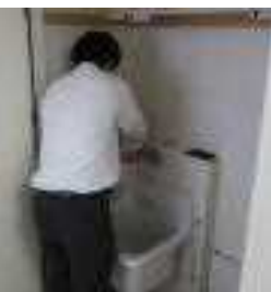
掃除班S君が懸命に