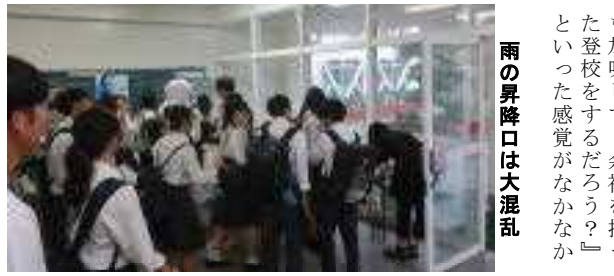
雨の昇降口は大混雑

最近ようやく暑さも和らぎ、灼熱地獄の様な日々からも解放されつつあります。しかしその分、雨が降ってきました。植物にとっては恵みの雨ですが、イカ高生にとって試験の雨です。ただでさえ、いつもギリギリに登校してくる人達は、交通機関の遅延などの遅延でも『即アウト』になってしまいます。『いやいや、普通は雨でなくても交通機関の遅延も加味して、余裕を持って登校するのだろうか?』という感覚がなかなか