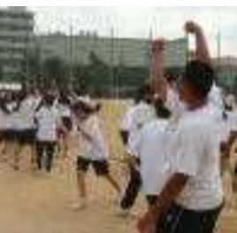
天高くラオウの様に