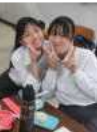
ベストスマイルに