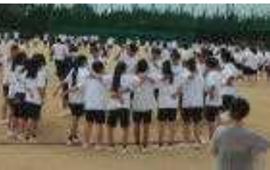
開始前の円陣です