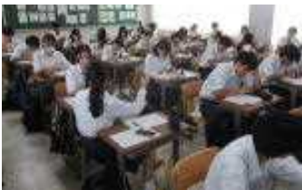
ワークシートを活用しての進路調べ