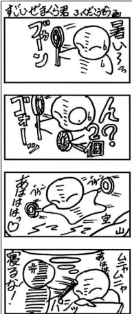
書かせ持持ち切りで書入りの学期を過ごしたい！

球技大会 どうだったの？ すっかり過去の事に思える『1学期球技大会』も、実はまだ一カ月半前の事です。そこで少し復習を！ 実施は7月12日(金)、グラウンドの状態が悪かったため雨(ドッジ)となり、ボール&卓球となりました。今回は2&3年の合同実施でしたが、それより計10クラスです(少なっ！) この日は久々にクラスTシャツ(文化祭で作った分)で集合です。探しまくった人もいれば、「寝間着に使ってたから急いで洗ったよ」という人もいました(笑)。本来はこの日、予選2回戦だった野球部も試合が雨で流れ、皆マスクを着けて参加しました(コロナが流行