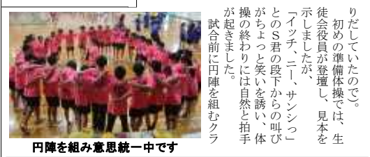
円陣を組み意思統一中です

兵庫県立伊川谷高等学校 48回生 発行所 〒651-2104 神戸市西区伊川谷町長坂 910-5 県立伊川谷高校 印刷室 電話 代表078-974-5630 FAX 078-974-5631 https://www.2hmg-cs.dl.weblog2/ikawadai-hs/