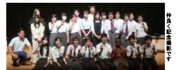
仲良く記念撮影です

た事はお湯が出る事！」「聴くだけのシンポジウムより、自分で考える事ができて良かった！」 パネラーさんや生徒からの声を聞いた後、いよいよ結果発表です。 1位 3年3組8グループ 2位 1年1組7グループ 3位 2年3組7グループ 各位、表彰状が渡されました。1位は副賞として各国のレトルト食品も付きました。1人が世界の水不足問題の中、水を大切にしている様子を大いに賞賛していただきました。 「先生の話でシンポジウムは無事終了しました。最後に、パネラーの皆さんとイカ高生生徒会、そしてゲスト参加していた『イカ北生徒会』とで記念写真をパシャリ！ 皆さん、お疲れ様でした！」