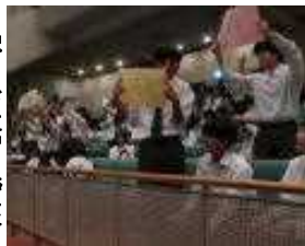
4択カードを高く上げます

れる飲み物は次のどれでしょう？ A...お冷や B...ビール C...白湯 D...漢方 「これならわり、ハハハッ」笑いが起きます。CとDに分かれました。答えは：「うわあ〜っ」 歓声が上がりました。