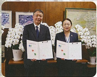
コープ神戸との連携式