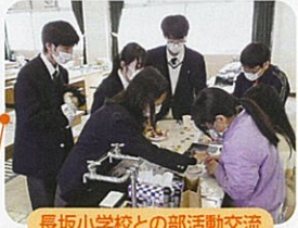
長坂小学校との部活動交流