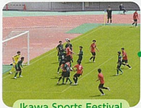
Ikawa Sports Festival