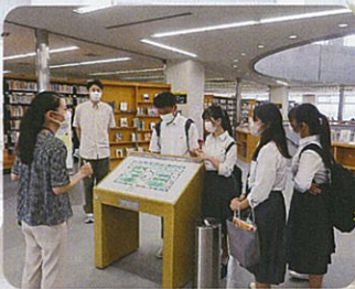
神戸学院大学の図書館訪問

本校は神戸学院大学、コープこうべと連携協定を結んでいます。一般の授業や総合的な探究の時間を利用して、相互交流を実施しています。