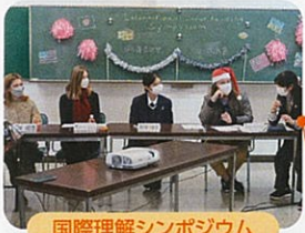
国際理解シンポジウム