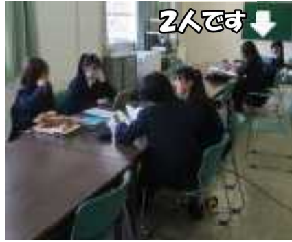
欠席者の多い授業でした

「提出用の用紙、今日休んでる人が持ってますっ！」 という班が2つもありました。しかしそこは仕方なし、授業担当者も鬼ではないので、その2班については提出日を延期してあげました。どの班もスライドの編集に苦しんでいます。編集というよりは、『どうすればスライドを編集できる状態になるか』で苦しんでいます。「グループドライブでスライドのファイルにアクセスしてダウンロードフォルダに落としたり、今度はマイクログソフトアカウントでオフィス365に入り、マイコンビュータのアップロードでアップする」と編集できるよ。」