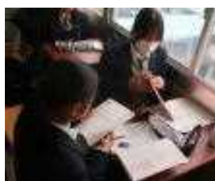
何が焦っています...

▼持久走 マラソン大会に向け、高校体育の定番である『持久走』が1月16日から始まりました。何やかやと言いつつも頑張り走る姿は、昭和も平成も、そして令和でも変わりありません。自分との闘いである持久走、しっかりな!