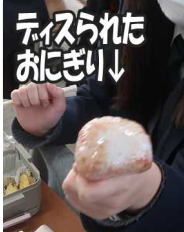
テイスられたおにぎり