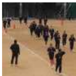
走る人達と見守る先生

※【用語解説】美味しんぼ 日本を代表するグルメ漫画のひとつ。昭和末期に連載が始まりアニメ化もされたが、コミックも巻を最後に現在休載中。山岡史郎はその主人公で料理の事以外ではいつも