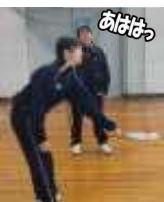
友見る間無く玉に翻弄

「かわいいのにしよ！」 まずはラケット選びに精を出します。 「持ち方は包丁の様に、どちらの面も使えます。目線は頭を越えない位に。」 簡単な指示の後、とりあえず3分間10回ラリー越えを目指します。3分毎にペアは交代します。