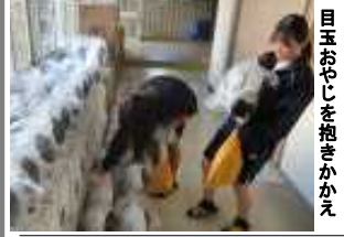
目玉おやじを抱きかかえ