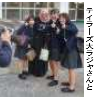
ティラーズ大ジャンと

▼動いているかな 午後から体育の人達、早くに体育館へ行き何をしているかというところ...『だるまさんが転んだ』をしているじやありませんか! 『だるまさんが転んだっ!』その瞬間をパシャリ!後