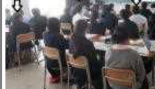
活躍するテューター達

事務室前に最近置かれていた多数の『目玉おやじ』あれは一体何？あれこそがアイリスオオヤマの誇る立体起動装置『上下首振りサーキュレーター(空気循環装置)』です。各教室では24時間換気が行われていますが、それに加えて室内の空気の循環を良くして、コロナやインフルエンザなどのウイルス対策をしようという訳です。