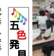
控え室の軽音楽部員

来たぞー、来たぞー Oラレちゃん! ではなく、誤植発見の知らせが来ました! (何故か嬉しい笑) 何と今回は、誤植の豪華二本立て(どれだけ間違えてるんぞツツツ)。一つ目は学年通信27号二面の『潜入!』これが高校音楽だ! の終わりから5行目、 誤...例が終わると 正...礼が終わると えつ、その間違える? 誤植でした。発見者は4組Nさんと1組K君です。見事に『まくら君復