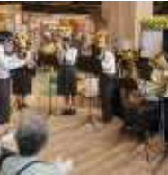
吹奏楽部の演奏です