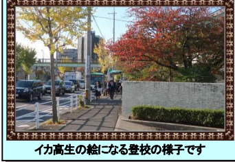
イカ高生の絵になる登校の様子です

11月はイカ高前の道も一気にイチョウが色づき、秋一色に変わります。赤や黄色の木々の下を登校する生徒達、その姿はモネの印象派に勝る絵画のようです。一部を切り取って額縁に入れてみると…ほら(笑)