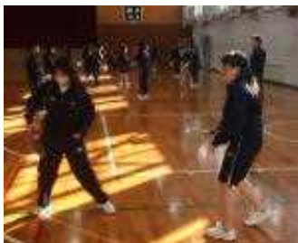
今回は体操服で挑みました

「フレスコボールって観たことある？」 「あ、大蔵海岸！」 ほう、結構手が拳がります。そうです、大蔵海岸を拠点に活動を行う「フレスコボール」。