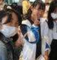
休みに駆けつける友

伊川谷高校と令和4年に教育連携を結んだコープこうべさん(関西人はコープにさん付けします)。そのレイアウトに大膽なコーナーを載せて頂きました。その名も何と、11月4日は『伊川谷高校DAY』吹奏楽部ミニコンサート 人形劇「ユウキのふしぎなおかしもの」 軽音楽部ミニライブ