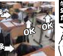
学校創立時に想い馳せ

11月2日(木)は、本来朝読の時間中である8時30分から校内放送が入りました。内容は2日後(11月4日)に迫る創立記念日についてです。一昨年11月に開設委員会が設置され、翌春に長坂小を借りての入学式、現在までに1万500名の卒業生を輩出。なかなか歴史のある学校です。1年半後に迎える伊川谷北高校との発展の統合により、来春の入学生は49回生)が最後のイカ高生となります。なかなか感慨深いものがあります。