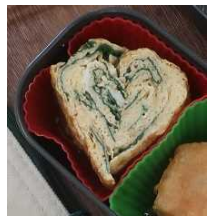
ハート型の卵焼きです

▼愛です 物事、少しの工夫でバラ色に変わる事って多々ありますよね。こちらの卵焼きを斜めに切つて向きを変えて、盛り付けるだけで、何とハート型に! 「すごいやん!」 「愛です!」