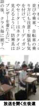
放送を聞く生徒達

10月31日は全授業45分で行い、昼に全校集会を開きました。ただしインフルエンザの流行に伴い、急きょ校内放送に変更です。 「学校のマナー、バスの並びや乗車、自転車の乗り方にも注意! 服装も気を付けて。カーディガンやセーターはネクタイが見えるように。防寒具はプレート」を看た上、話をした後、クラス毎に廊下へ