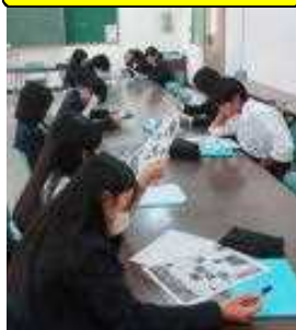
通信見ながら振り返り中

そうですね、何でも「やりっぱなし」が一番「もったいない」のです。そこで10月31日の2学期のメイン活動であった『やさしい日本語新聞書き換え講座』と『赤ちゃん先生』の振り返りを行いました。前半は赤ちゃん先生の振り返りです。各クラスバラバラで班を組み、自身の赤ちゃん