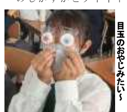
目玉のおやじみたい、お母さんが楽しんできましたね。お茶目な母です(笑)。

▼よく分かるノートノートの作り方の工夫は皆、千差万別です。そんなノートで見て取れます。因みにこちらの数学ノート、式でかけ算を忘れていた様ですが、解いた人の「嘆き」がとてもよく伝わってきました。これもノートづくりの工夫のひとつかな?