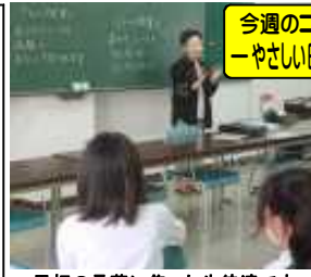
黒板の言葉に集った生徒達です

10月3日(火)は、ついに新聞記事書き換えの最終日。始めに塩川先生の5分間講座が入ります。『今日の授業の進行について』の協議は長引くと予想されます。