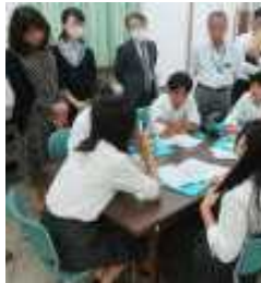
生徒人数より多い参加者に囲まれて