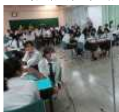
この場での全体発表は気合いが必要

兵庫県NIE推進協議会主催の公開授業が本校で行われました。時は10月10日(火)の6限、場所は会議室、そして対象は1年コミュニケーション類型の面々です。当日の外部参加者はアル24名、オンライン9名という盛り上がり。顔ぶれも小中高大特別支援の先生から教育委員会、国際交流団体、出版社等、新聞社も5社来ていました(ちよっと大変)。授業の内容は、本誌でも19号から度々特集を組んでいる「やさしい日本語」を用いた新聞記事のまとめ直しです。新聞感想文コンクールに用いた新聞記事を生徒各自がA5のはがき新聞にまとめました。その作品発表を公開した訳です。まずは班別発表、班内でそれぞれ自作品の工夫点や特徴を交えながら、記事の内容を発表していきます。「読みやすい字の大きさを考えました！」