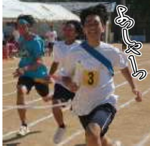
各クラスの『友情』を繋ぐシーンです