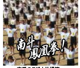
定番のラジオ体操第一

爆風・ランナー 前日の予行で行われた女子100m、男子200mの決勝は、学年の枠を超えて走者が競いました。「そりゃあ、いけえっ」友情たっぷりハンギョウに