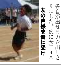
各自が出せる力を出しきりました。次に女子4×100m、更に男子4×200mリレー決勝です。クラス優勝への「夢」を繋ぐベトン、これを4名の生徒が継ぎます。若者の一生懸命な姿は何者にも代え難い美しさです。

爆風・ランナー 前日の予行で行われた女子100m、男子200mの決勝は、学年の枠を超えて走者が競いました。「そりゃあ、いけえっ」友情たっぷりハンギョウに