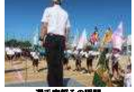
選手宣誓その瞬間