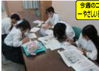
黙々と順調に作業を進めています

9月19日(火)は『やさしい日本語新聞書き換え講座』の2回目、いよいよ記事の書き換えスタートです。下書き用紙を配布し、再度今から行うことを説明する担当者(本誌編集長)です。一生懸命