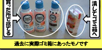
過去に実際ゴミ箱にあったモノです

教室や廊下のゴミ箱に捨ててよいのは『燃えるゴミ』だけです。ペットボトルは買ったところで捨てましょう。また、紙パックジュースはキッチンで潰しておきましょう。そのとき決して足で踏み踏みしない事！ストローから中の残り液がピュッと出て、スポンに飛び散る可能性大ですから..