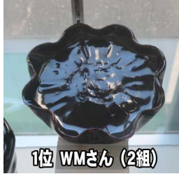
1位 WMさん (2組)

学年通信前号にて発表された『焼き物コンテスト』その発表は入賞者のイニシャルだけで、 「実際の作品はどんなだろうと思う人も多かったことでしょう。そこで今回は、トップ3の作品の写真を掲載します。ただし、掲載写真はガラスケースに入れたままの姿で写されているため、その魅力が今ひとつ伝わりにくいところがあります。 「えっ、魅力が伝わりにくいって分かってるんだから、もっとキレイに撮ってよっつ」 「実際の作品はほんたうにうっつ、魅力が伝わりにくいって分かってるんだから、もっとキレイに撮ってよっつ」