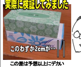
実際に検証してみました このわずか2cmが...

平成初期は200枚×5箱で特売200円を切っていたティッシュも、平成中期には160枚、150枚入りでも余裕で200円を越えるようになった。さらにコロナ騒動でティッシュが無くならないという噂が流れたときには、尋常でない価格まで値上がりした。そんなティッシュであるが、ある日プライベートブランド(イオン系列)というトップバリュの商品などでもないのに200枚×5箱で200円を切るティッシュが売られた。大変お買い得であったので飛びついた。しかし、使ってみると妙に違和感がある。その原因はすぐに分かった。長さが短いのである。▼従来のティッシュボックスと重ねるとキツチリ2cm幅が短い。何十年も使い慣れていたものに、この2cmの差は大きな違和感と今となっては、おそろしくは今の世の中、一般庶民である私たちが気が付かぬ所である。それがティッシュと変えられているのだから。もし何かに違和感を感じたときは、気のせいと思わずに少し調べてみるのも良いかもしれない。ちよつとした「からくり」に気付くかも知れません。その「からくり」が笑って済ませられるモノ、だが。(福田)