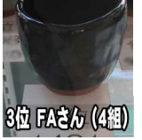
3位 FAさん (4組)