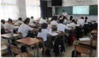
授業でのICT機器の活用は日常茶飯事に

いつの間にか2学期も半月が過ぎ、すっかりと通常営業に戻ったイカ高ですが、ボツボツとよからぬ授業態度の話が聞こえてきます。 「授業中にピーチクパーチクはあかんぜ！」というところ、教室をささくきび煙と間違えてる人達が居る様です。 「授業中にピーチクパーチクはあかんぜ！」とおつ、そこから教えないといけないか。これはしてやられました。一から丁寧に教えてあげます。 「先生つ、ピーチクパーチクってなんでですか？」 「おつ、そこから教えないといけないか。これはしてやられました。一から丁寧に教えてあげます。」 「ピーチクパーチクはピーチクパーチクちゃ全然丁寧じゃありませんね(苦笑)。そこでこの紙面を借りて説明します。」