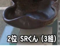
2位 SRくん (3組)