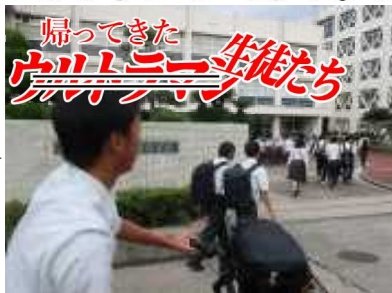
校舎に吸い込まれる生徒達

朝読開始8時25分 朝読とは「朝のドタバタから気持ちを切り替え、一日の始まりを気持ちよく迎える」という取り組みです。なので8時25分になってドタバタじゃ意味ないやん。一日の始まり、落ち着きを持って読書に取り組みませう!