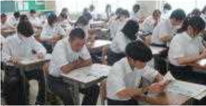
心新たに朝読に取り組みステキな人達

建礼門院・平徳子は平清盛の娘であり、高倉天皇の中宮にして安德天皇の母である。壇ノ浦の合戦の最中、母二位の尼とともに我が子安德天皇が海中へ沈むのを見、一門が皆次々と死んでゆくを見届けた人である。