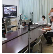
小会議室より発信中

OHSS 夏に実施 夏の風物詩といえば、「オープンハイスクール」。この伊川谷高校で8月22日(火)の午前・午後、23日(水)の午前で合わせて3回実施しました。合わせて総勢600名弱、皆さんよく集まってくれました。感謝感謝!暑い時期なので、涼しい教室にて小会議室からの発信を聞くオンライン形式