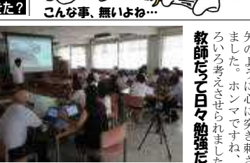
図書室での職員研修

大事なお知らせ! 我々教員も、常に互いの授業を見ながら良きところを取り入れていこうと努力を続けています。ところが最近、いろんな教師がちょっと教室後から授業を覗こうとすると、 戸が開けて見えんわ!わ! という事象が多発しております。なので皆さん、 教室前線の戸を開ける位開けておく ようお願いいたします。