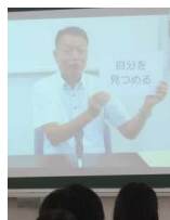
「自分を見つめる」用紙