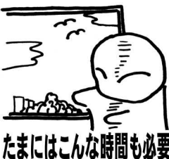
たまにはこんな時間も必要

「人権」って何ぞ？ そんな事を考えたことはな... 『いじめ』『就職差別』『国籍の違いによる差別』等々いろいろ出てきます