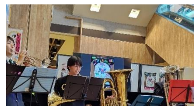
演奏中の吹奏楽部の生徒の様子