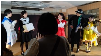
演劇部の演劇「魔法少女ファンタジアリーベ」の1シーン

当日は、コープを訪れた多くの方々が、生徒の発表を見てたくさんの拍手を送ってくださいました。本校の取組が、多くの方々の助けによって支えられていることを実感する1日となりました。