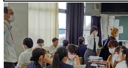
テーマ披露後にグループに分かれディスカッションする様子