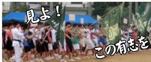
体育大会時の目玉『武行進』

頑張ってます。そんな伊川谷高校の部活動、どの部も今まで以上に新入生である君たちの力に期待しています。さあ、青春の1ページ、君と一緒に伊川谷高校で爽やかな汗を流そう！