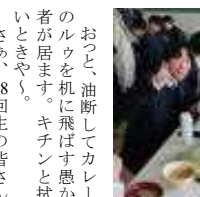
食堂でも楽しそう！

えっ？ 机の上にビエトロッドレンジングが1本乗っているやんか！ときにはこんな驚きもあるんです(笑)。