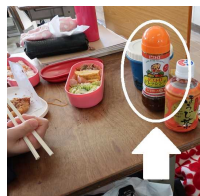
テカイトレンジング

中学に無くて高校にあるモノ 高校生活に色を付けるモノ、それは『お昼の時間』です。ある者は弁当を開けて、「梅干だけやんケー」と叫び、ある者は「箸入ってへんっつ」と喚く、そんな皆の笑顔が教室に溢れる瞬間です。