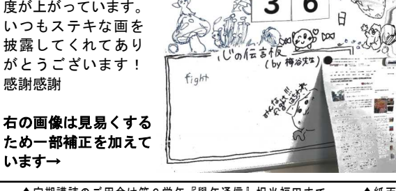
入試結果は自ら報告が礼儀です

「決して中を覗かないで下さいね」 受験の結果によって、担任が渡した調査書が不必要になる場合があります。そんなときは、「決して中を覗かないで下さいね」という紙ではありませんが、重要書類なので使わなかったら必ず担任に返却して下さい。