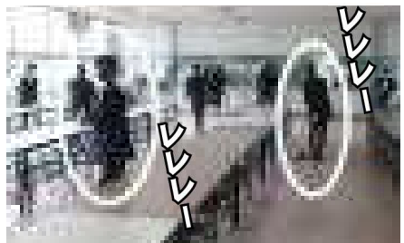
イカ高のレレレ達!

▼レレレのお兄さん 「おっ出か〜し〜すか? レレレレ〜のら〜ホウキで掃く人はレレレレのお兄さん(出典:天才バカボン)です。ここイカ高の食堂では、閉店間際の13時頃になると、レレレレのお兄さん&レレレレのお姉さんが現れ、床をホウキで掃いたり、テーブルを雑巾で拭いたりしてくれます。実はこれ、各々