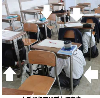
上手に机下に隠れています

10時からようじに入る放送、「これからシェイクアウト訓練を始めます。」 「これからはみ出てるのは、身体が大きいからだけでは無いです。頭隠さず尻隠しての人は注意です。これで皆、無事机の下に収まりました。その身体をまとめた姿は「超ロボット生命体トランスフォーマー」の様でした。