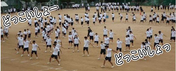
初の合体! ソラーン軍団

イカ高伝統フォークダンスの代わりに取り入れられたソラーン節ですが、その演技は如何に? 結果は学年通信次号に期待!