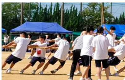
綱引きの様子（2年生）