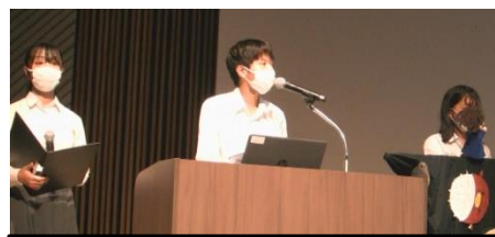
ボランティア部生徒の発表の様

本校生徒は「幼少の頃からSDGsについて考えることが大切であり、考えるきっかけとして人形劇は有効の手段の一つである」という意見を披露しました。