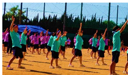
よさこいソーランを踊る3年生