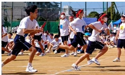
リレーの様子（1年生）