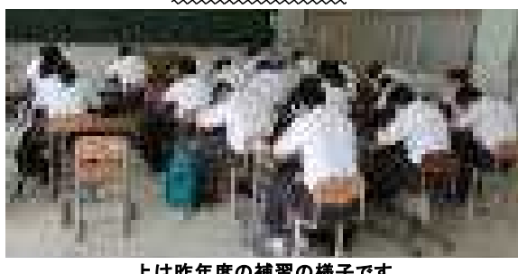
上は昨年度の補習の様子です

「先生～、今年は夏補習って無いんやろ？」 無い訳無いやん！ という訳で、左図(←)の様に行きますので、しっかりと参加してな！ (参加しただけで勉強した気分になるのは無しやで～)