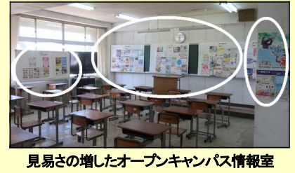
見易さの増したオープンキャンパス情報室

A203教室に設置されている『オープンキャンパス情報室』が全面リニューアル、新装開店となりました。これで少々風が吹いても、チラシが飛んでいく心配もなくなりました。見易さもバツグンです。是非また利用して下さい。