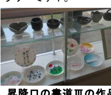
昇降口の書道Ⅲの作品

生徒昇降口に書道Ⅲの作品が展示されていました。上段には1年生が篠山遠足で作った陶芸が飾られています。廊下の柱の要所要所には美術Ⅲの作品が展示されています。ちょっとしたアートギャラリーですネ。