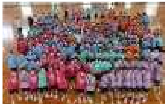
みんな揃って記念撮影です！

試合途中、別件で〇君母から電話あり、そこで「晴れて良かったですね。息子、楽しみにしていました。」